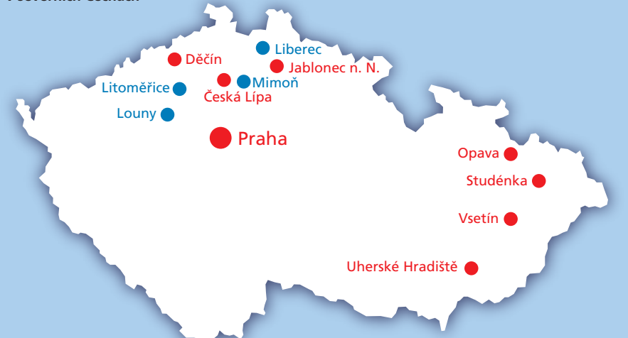
Mapka regionálního rozložení dceřiných účastí MVV Energie CZ po expanzi v severních Čechách

* MVV Energie CZ vlastní minoritní podíl (35%) ve společnosti ČESKOLIPSKÁ TEPLÁRENSKÁ a. s., která vyrábí a dodává teplo v České Lípě. V ostatních dceřiných společnostech má MVV Energie CZ majoritní podíly nebo je jediným akcionářem.