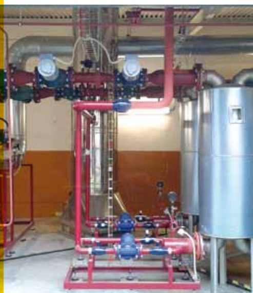
Nový centrální výměník je umístěn přímo v kotelně Olomoucká a sídliště zásobuje vodou o 90 °C.