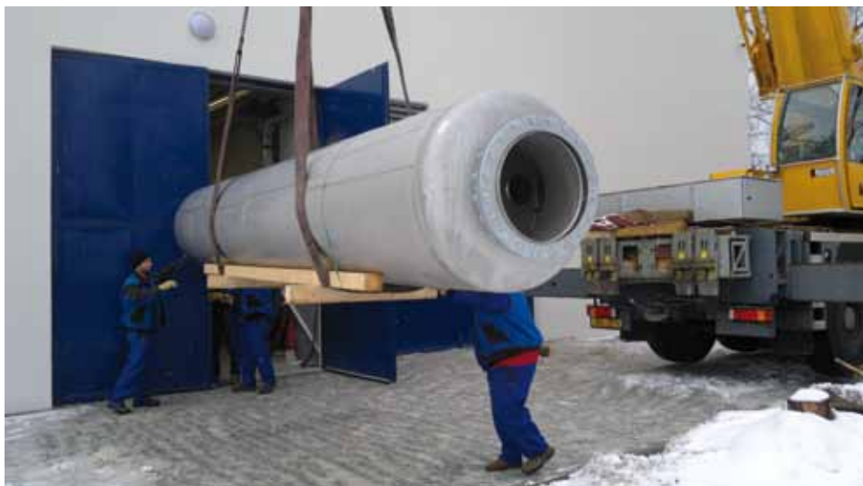
Přesun jednotlivých částí dovnitř nové kotelny si vyžádalo těžkou techniku.