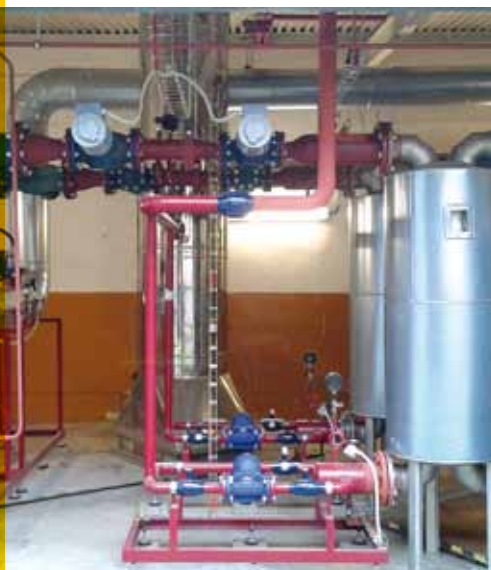
Nový centrální výměník je umístěn přímo v kotelně Olomoucká a sídliště zásobuje vodou o 90 °C.