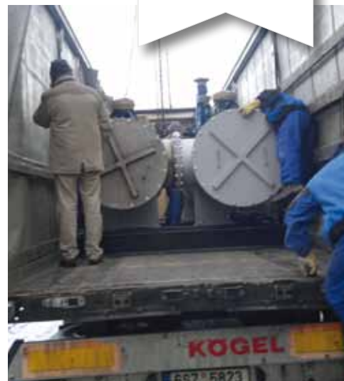
Všechny části nových zařízení přivezlo do areálu několik kamionů na začátku února.

Kamióny s kogenerační jednotkou s tepelným výkonem 1750 kW a elektrickým výkonem 1560 kW zamířily do Liberce začátkem února. Zařízení doplní v místě kotelny také nádrž o užitém objemu 340 m 3 , ve které se bude akumulovat nespotřebované teplo pro pozdější využití.