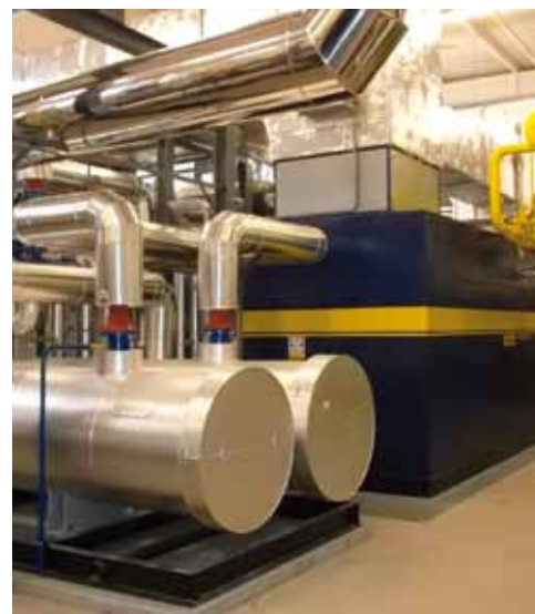
Celkový pohled do nově zrekonstruované kotelny na sídlišti Františkov (nahofe) a nová kogenerační jednotka v protihlukovém rámu (vlevo).

Práce na uvedení celé jednotky do provozu pokračovaly podle harmonogramu a na konci března byla kogenerační jednotka připravena na provozní zkoušky. Pokud nedojde k žádným neočekávaným komplikacím, tak bude v dubnu motor ve zkušebním režimu, který by měl v průběhu června přejít do trvalého provozu. Nově se tak bude na libereckém sídlišti Františkov vyrábět elektrická energie v moderní kogenerační jednotce.