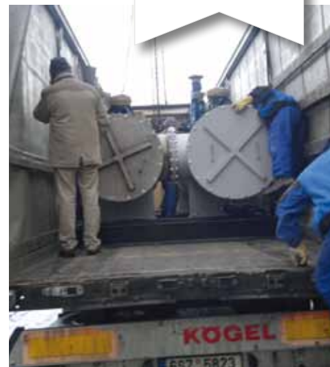
Všechny části nových zařízení přivezlo do areálu několik kamionů na začátku února.

Kamióny s kogenerační jednotkou s tepelným výkonem 1750 kW a elektrickým výkonem 1560 kW zamířily do Liberce začátkem února. Zařízení doplní v místě kotelny také nádrž o užitém objemu 340 m 3 , ve které se bude akumulovat nespotřebované teplo pro pozdější využití.